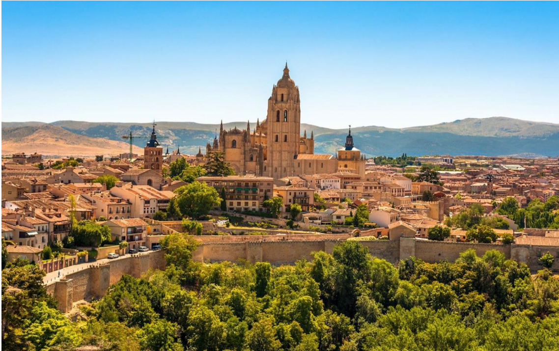
PANORÁMICA DE SEGOVIA