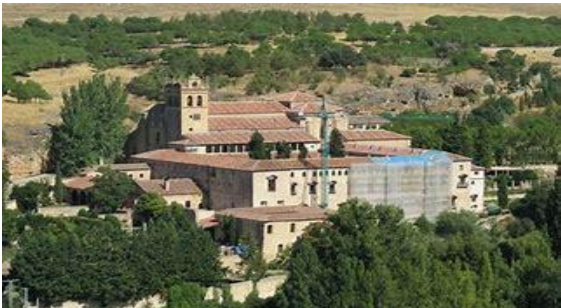
MIRADOR DEL VALLE DEL ERESMA